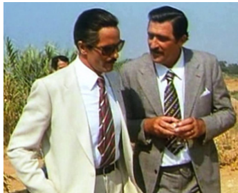
1977 CORLEONE (Corleone) de Pasquale Squitieri avec Francisco Rabal