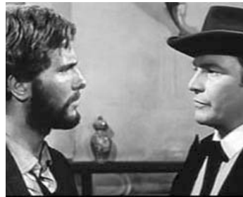
1965 LE DOLLAR TROUÉ (Un Dollaro bucato) de Giorgio Ferroni avec Pierre Cressoy