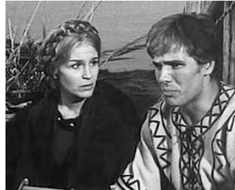
1964 ERIK LE VIKING (Erik, il Vichingo) de Mario Caiano avec Carla Calò