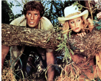
1975 AFRICA EXPRESS (Africa Express) de Michele Lupo avec Ursula Andress