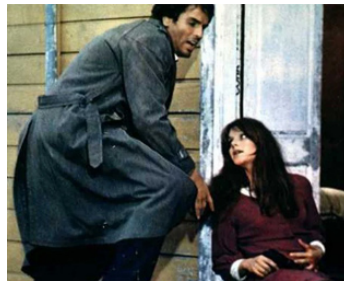
1968 LE DERNIER GUET-APENS (Corbari) de Valentino Orsini avec Tina Aumont