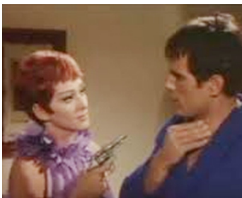
1965 KISS KISS BANG BANG de Duccio Tessari avec Lorella De Luca