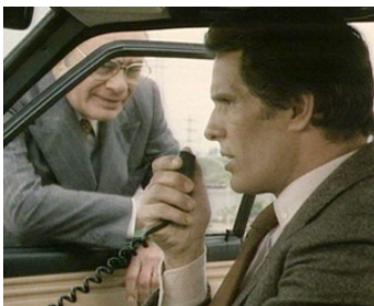
1980 L'AVERTISSEMENT (L'Avvertimento) de Damiano Damiani avec Martin Balsam