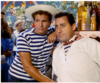
1958 LES DEUX GONDOLIERS (Venezia, la luna e tu) de Dino Risi avec Alberto Sordi