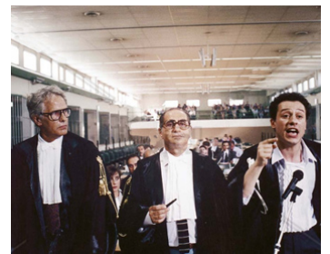
1999 UN HOMME PARFAIT (Un Uomo perbene) de Maurizio Zaccaro avec Stefano Accorsi