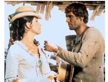
1965 ADIOS GRINGO (Adios Gringo) de Giorgio Stegani avec Marisa Mell