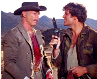
1967 LE DERNIER JOUR DE LA COLÈRE (I giorni dell'ira) de Tonino Valerii avec Lee Van Cleef