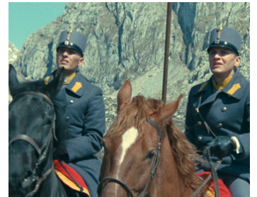
1976 LE DÉSERT DES TARTARES (Il deserto dei Tartari) de Valerio Zurlini avec Jacques Perrin