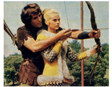
1970 LA GRANDE CHEVAUCHÉE DE ROBIN DES BOIS de G. Ferroni avec Silvia Dionisio