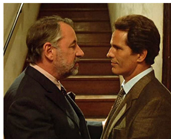
1985 POURVU QUE CE SOIT UNE FILLE (Speriamo che sia femmina) de M. Monicelli avec Ph. Noiret