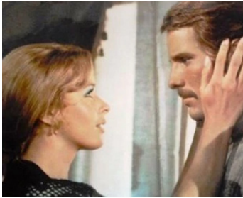
1971 LA LIGNE DE FEU (L'Amante dell'Orsa Maggiore) de V. Orsini avec Senta Berger