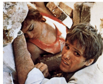
1968 LES BÂTARDS (I Bastardi) de Duccio Tessari avec Rita Hayworth