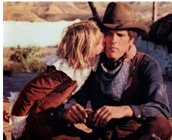
1977 LA SELLE D'ARGENT (Sella d'Argento) de Lucio Fulci avec Sven Valeschi