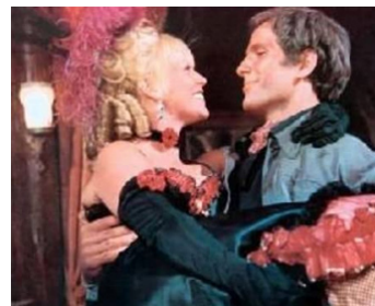
1966 TROIS CAVALIERS POUR FORT YUMA (Per pochi dollari ancora) de G. Ferroni avec S. Daumier