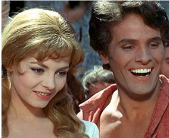
1964 ANGÉLIQUE, MARQUISE DES ANGES de Bernard Borderie avec Michèle Mercier