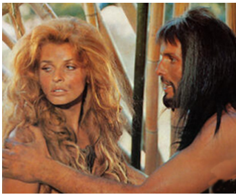
1968 QUAND LES FEMMES AVAIENT UNE QUEUE de Pasquale Festa Campanile avec Senta Berger