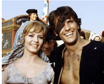
1964 MERVEILLEUSE ANGÉLIQUE de Bernard Borderie avec Michèle Mercier