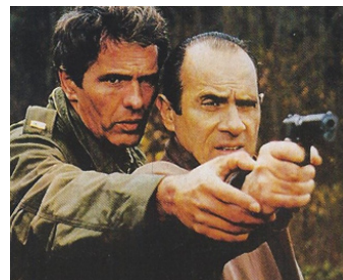
1987 CHÂTEAUX DISTRICT de Philippe Charigot avec Guy Marchand