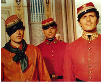
1962 LE GUÉPARD (Il Gattopardo) de Luchino Visconti avec Alain Delon, Terence Hill