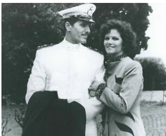
1984 CLARETTA (Claretta) de Pasquale Squitieri avec Claudia Cardinale