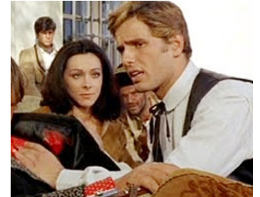
1964 UN PISTOLET POUR RINGO (Una Pistola per Ringo) de Duccio Tessari avec Lorella De Luca