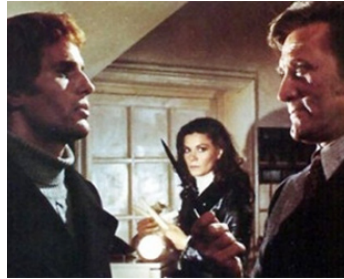
1972 UN HOMME À RESPECTER (Uomo da rispettare) de M. Lupo avec Florinda Bolkan, Kirk Douglas