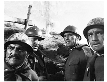
1962 LE JOUR LE PLUS COURT (Il giorno più corto) de S. Corbucci avec F. Giacobini, Ph. Leroy