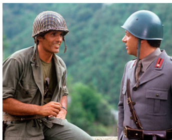
1981 LE PONT (Ciao nemico) d'Enzo Barboni avec Johnny Dorelli