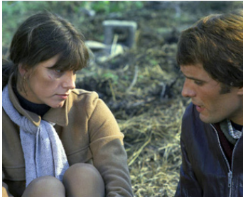
1973 UN VRAI CRIME D'AMOUR (Delitto d'amore) de Luigi Comencini avec Stefania Sandrelli