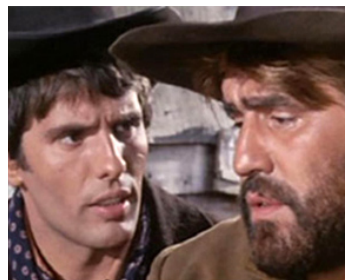
1968 LE CIEL DE PLOMB (E per tetto un cielo di stelle) de Giulio Petroni avec Mario Adorf