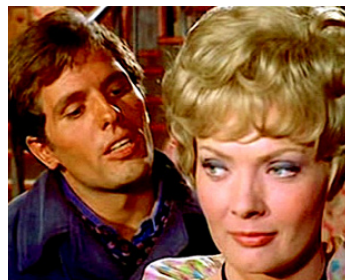
1966 ARIZONA COLT (Il pistolero di Arizona) de Michele Lupo avec Corinne Marchand