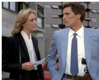
1982 TÈNÈBRES (Tenebre) de Dario Argento avec Carola Stagnaro