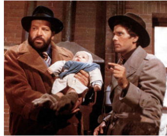
1972 LES ANGES MANGENT AUSSI DES FAYOTS d'Enzo Barboni avec Bud Spencer