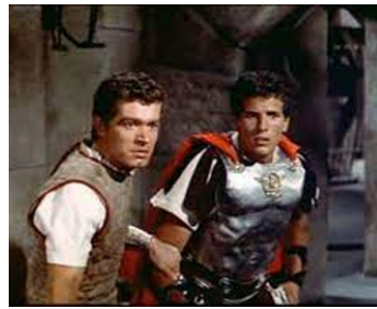
1959 BEN-HUR (Ben-Hur) de William Wyler avec Stephen Boyd