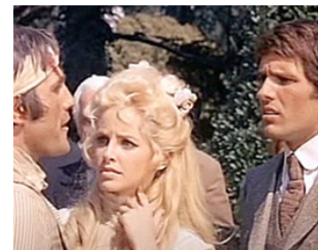
1968 LA CHEVAUCHÉE VERS L'OUEST de Duccio Tessari avec Nino Benvenuti, Sydne Rome