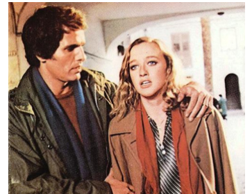
1978 UN UOMO IN GINOCCHIO de Damiano Damiani avec Eleonora Giorgi