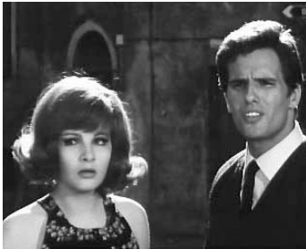
1965 LA RAGAZZOLA (La Ragazzola) de Giuseppe Orlandini avec Agnès Spaak