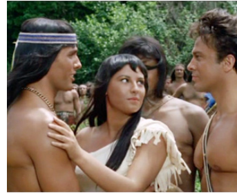
1963 HERCULE CONTRE LES FILS DU SOLEIL d'Oswaldo Civirani avec Mark Forest