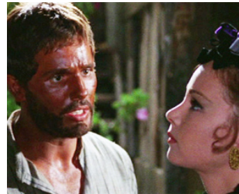
1965 LE RETOUR DE RINGO (Il Ritorno di Ringo) de Duccio Tessari avec Monica Vitti