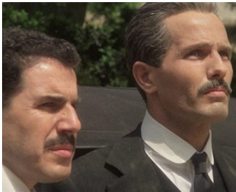
1976 L'AFFAIRE MORI (Il Prefetto di Ferro) de Pasquale Squitieri avec Stefano Satta Flores